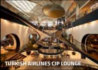
TRUKISH AIRLINES CIP LOUNGE